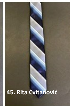
45. Rita Cvitanović