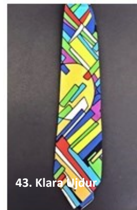
43. Klara Ujdur