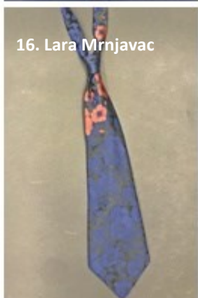
16. Lara Mrnjavac