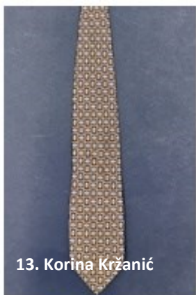
13. Korina Kržanić