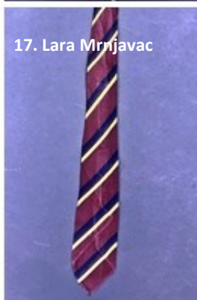
17. Lara Mrnjavac